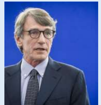
EP prezidents Dāvids Marija Sasoli

“Mēs piedzīvojam to laiku, kad pilsoņi vēlas uzņemties atbildību, viņi vēlas paust viedokli par politikām, kuras ietekmē viņu ikdienu, viņu nākotni, planētas nākotni.”