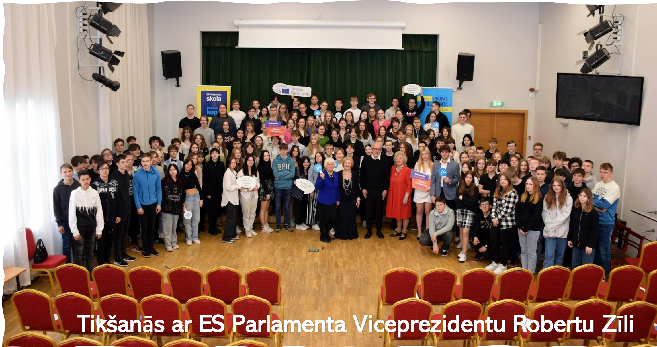
Tikšanās ar ES Parlamenta Viceprezidentu Robertu Zīli