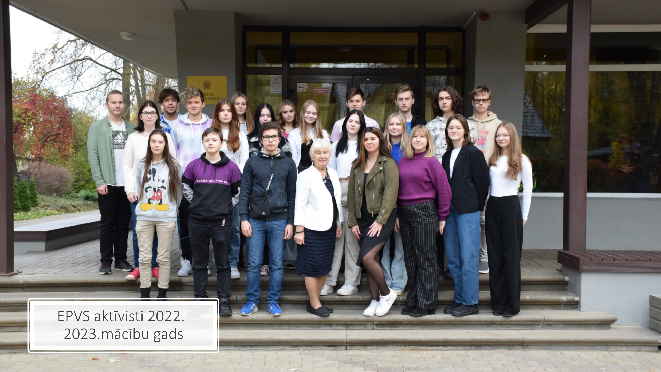
EPVS aktīvisi 2022.- 2023.mācību gads