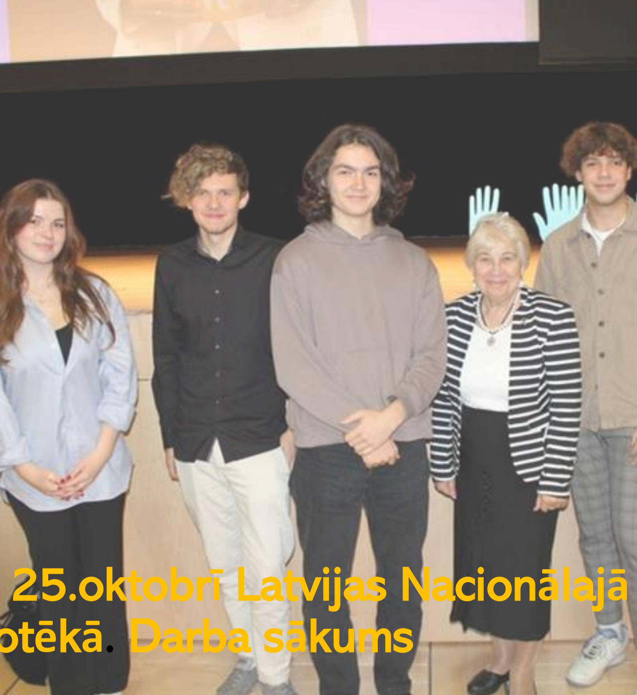
EPVS atklāšana 25.oktobrī Latvijas Nacionālajā bibliotēkā. Darba sākums